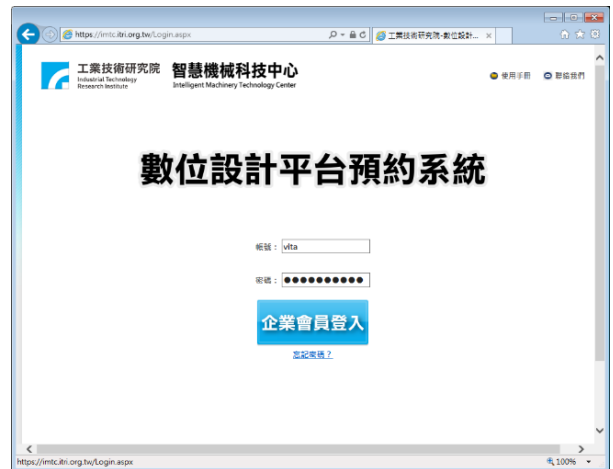
企業會員預約系統登入畫面