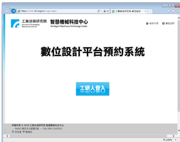
工研人預約系統登入畫面